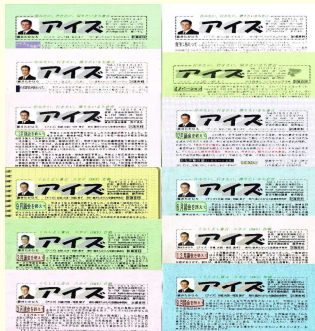
アイズ1号~13・14合併号

を推進してきました。活動状況は、定例議会ごとに発行してきた「アイズ」1~14号のとおりです。