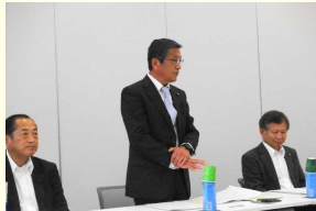
常任委員会視察代表あいさつ