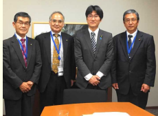
県選出国會議員への要望活動