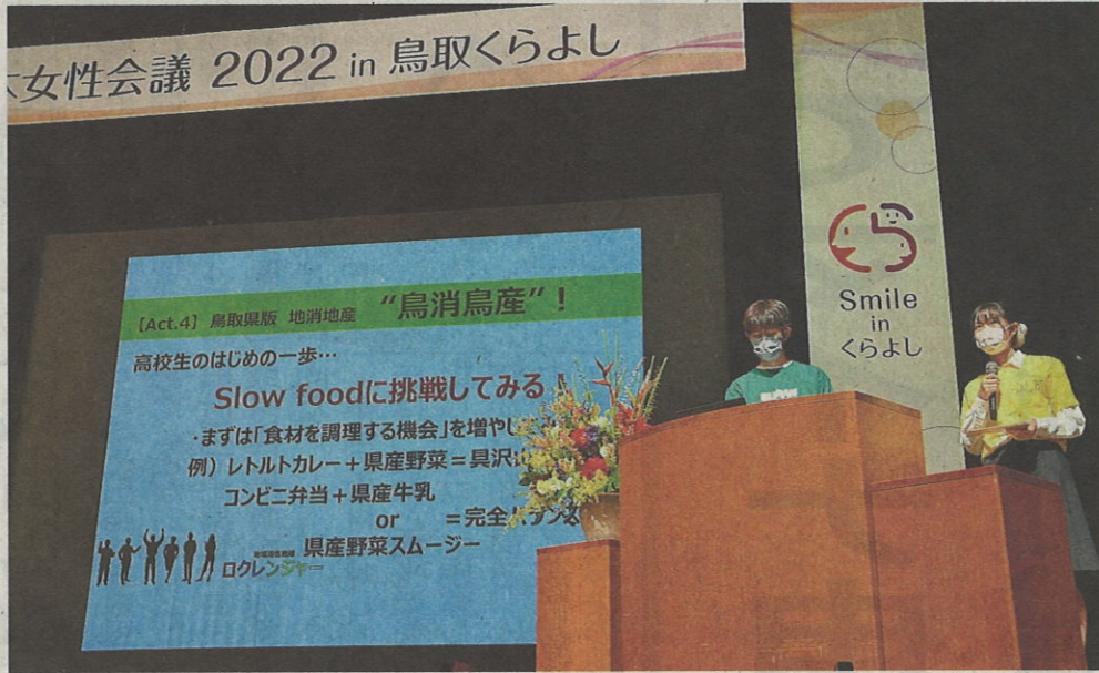
未来創造コンテストで発表する高校生=28日、倉吉未来中心

「日本女性会議2022 in鳥取くらよし」(実行日、倉吉未来中心を主会場)が28