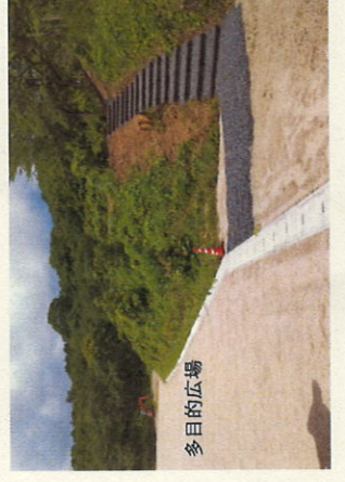
階段、蓋掛け R6.6月5日撮影