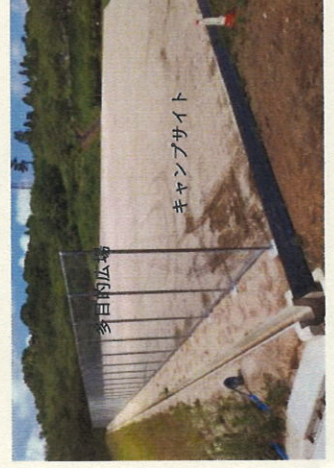
造成状況 R6.6月5日撮影